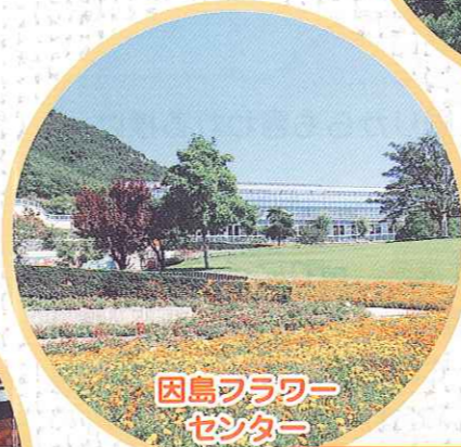
因島フラワーセンター