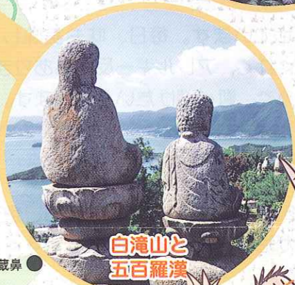
白滝山と五百羅漢