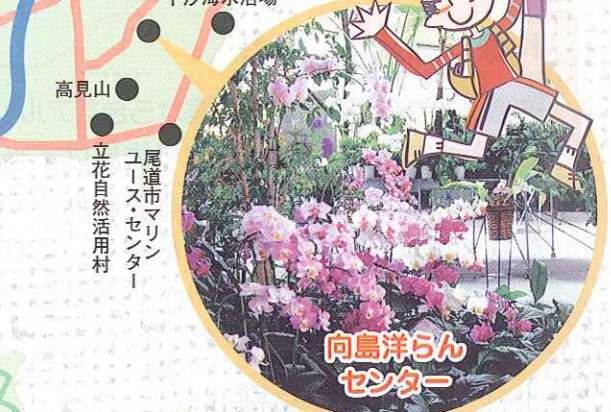
向島洋らんセンター